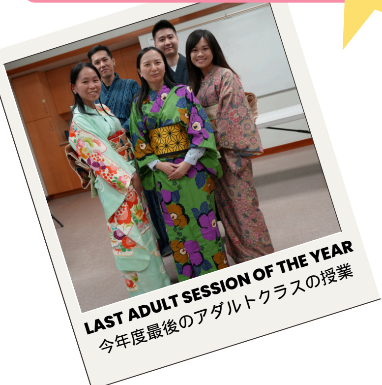
LAST ADULT SESSION OF THE YEAR 今年度最後のアダルトクラスの授業