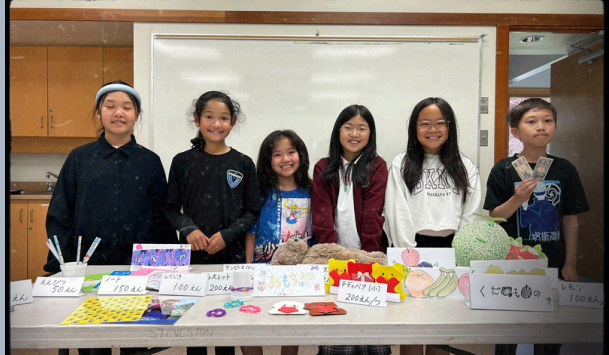
PRESENTATION WEEK JR FUNDAMENTAL CLASSES 学習発表会（基礎科クラス）