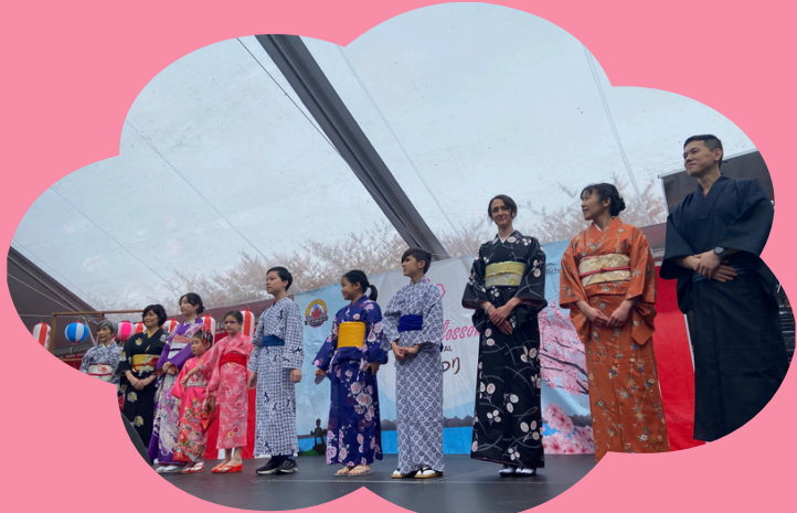
RICHMOND CHERRY BLOSSOM FESTIVAL 2024 2024年リッチモンド桜まつり