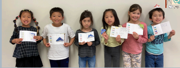
CHILDREN'S DAY FUTSUKA CLASSES 子どもの日パーティ（普通科クラス）