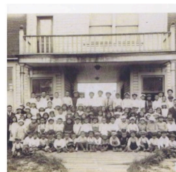
All the students at Lord Byng Elementary School (located in Steveston) in 1922. Children from Nikkei families attended Japanese School after their day at public school was over.