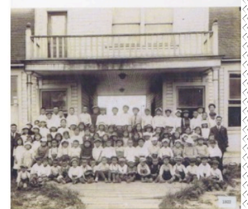
スティーブストンにある公立校 ロードピング小学校の全生徒 (1922年) 日系の子供たちは放課後に 日本語学校に通っていた